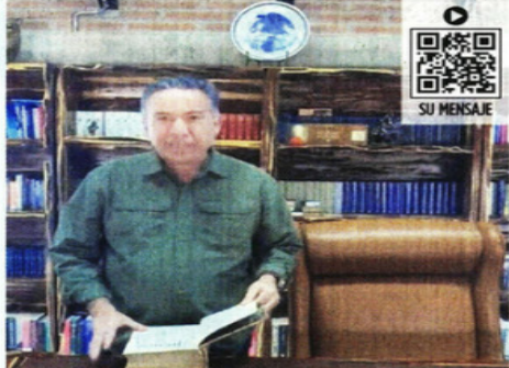
EN SU TERRUÑO. Inzunza compartió un video desde Badiraguato y aseguró que volverá al Senado.

"El truco no es que pierda el fuero, el truco es quererlo juzgar en México para luego decirle a Estados Unidos que nadie puede ser juzgado dos veces por el mismo delito, porque ese es un principio internacional, el non bis in idem", indicó.