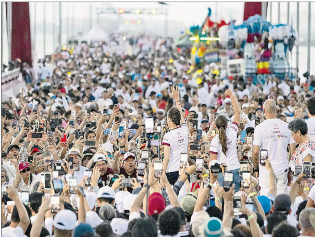
▲ "Donde antes había corrupción, hoy hay honestidad; donde antes había desigualdad, hoy hay igualdad; donde antes se construían barreras, hoy se construyen puentes", declaró la Presidenta al inaugurar el paso elevado Nichupté, en Cancún, Quintana Roo, ante 15 mil personas que participaron en una