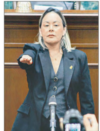
▲ El Congreso resolvió con 33 votos a favor, tres en contra y dos abstenciones. Bonilla, de 33 años, ha sido diputada local y encargada de despacho de la Secretaría de Seguridad estatal.

GUSTAVO CASTILLO, ANDREA BECERRIL E IRENE SÁNCHEZ, CORRESPONSAL / P 3