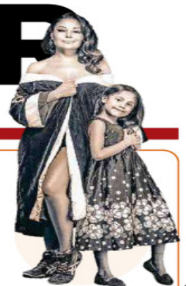
La actriz Cynthia Nixon, la cantante Melissa Etheridge o la conductora Ellen DeGeneres crían a sus hijos en familias lesbomaternales.