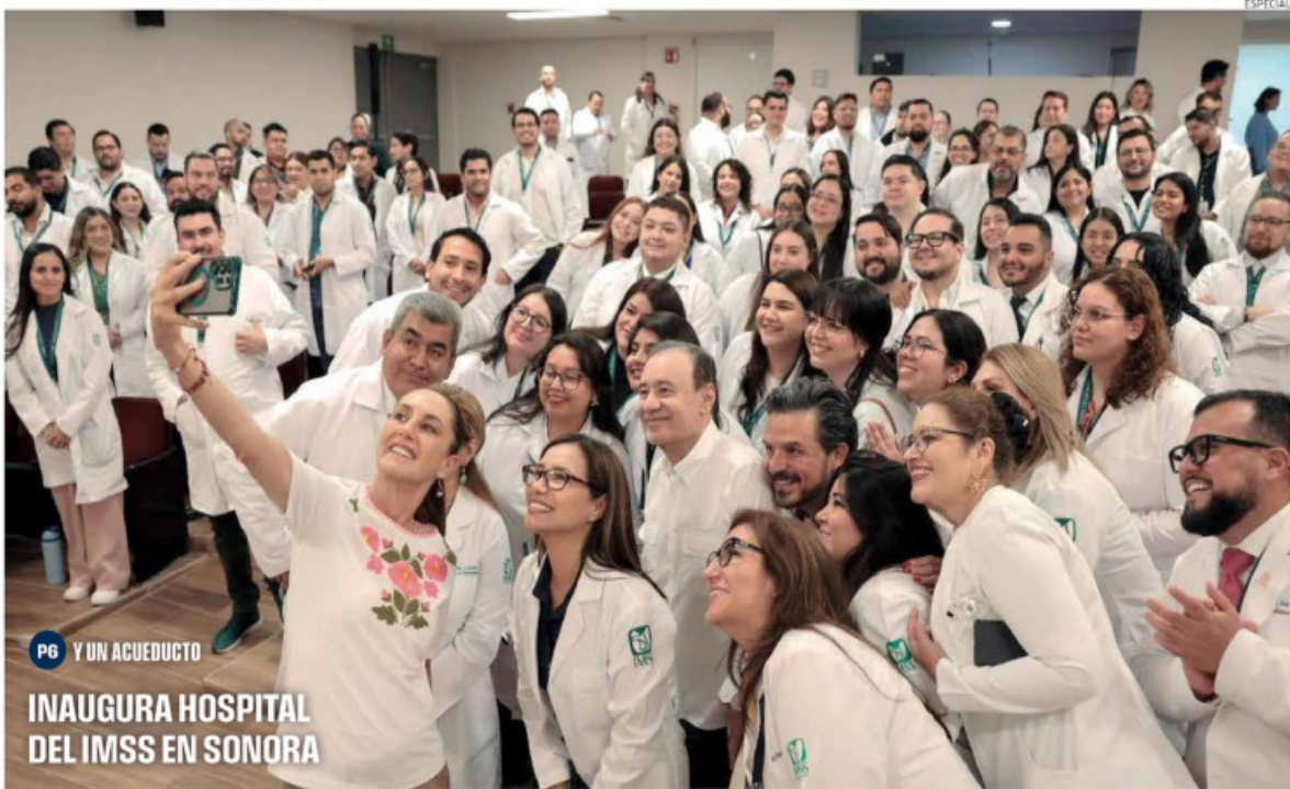
P6 Y UN ACUEDUCTO INAUGURA HOSPITAL DEL IMSS EN SONORA