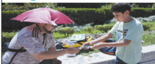
FERNANDA ROJAS, EL UNIVERSAL

● Los alrededores del Palacio de Bellas Artes se convirtieron en un tianguis futbolero, donde aficionados compran, venden e intercambian estampas del famoso álbum del Mundial 2026. ● UD B3