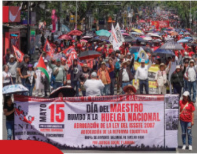
MAESTROS caminan sobre Reforma, ayer.

SECCIÓN 9 critica a Delgado por cierre anticipado del ciclo escolar; garantiza CSP gestión para mejorar condiciones del magisterio y descarta posible salida del titular de la SEP. págs. 8 y 9