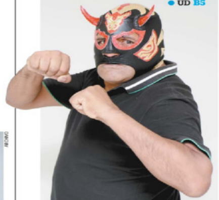
JUAN BOITES, EL UNIVERSAL