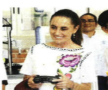
La Presidenta Sheinbaum estuvo de gira en Yucatán.