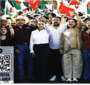
Simpatizantes de Maru Campos bloquearon los accesos a Chihuahua para impedir la llegada de morenistas. Luego, Andrés Manuel López Beltrán fue abucheado en el aeropuerto. Por la tarde, la dirigencia de Morena pidió juicio político contra la panista.