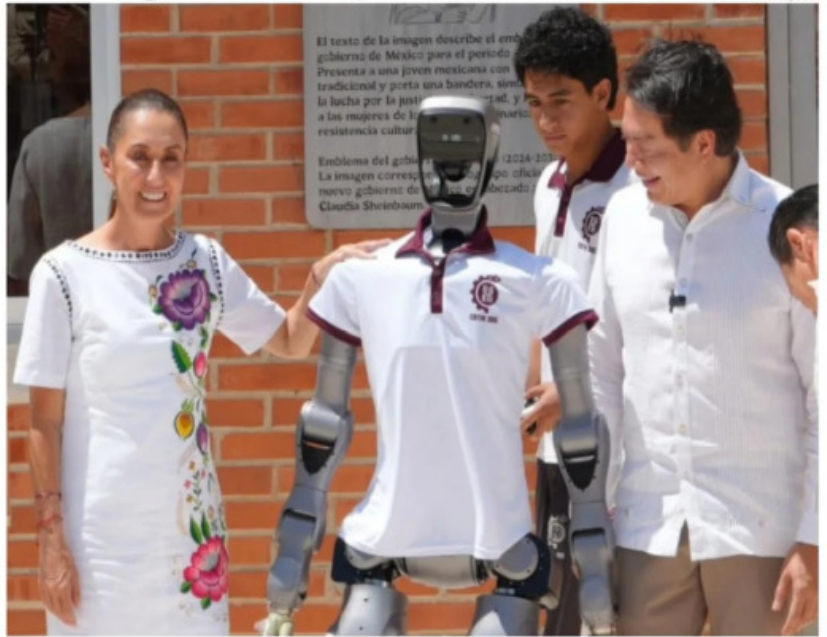
La presidenta Claudia Sheinbaum inauguró este sábado el Centro de Bachillerato Tecnológico Industrial y de Servicios (CBTIS) No. 305 en Mérida, Yucatán, acompañada del titular de la SEP, Mario Delgado, y de otros funcionarios, antes de cortar el listón la sorpresa fue la presencia de “Atom”, un robot que portando una playera con el logotipo de la escuela, participó en la inauguración. PAG 6