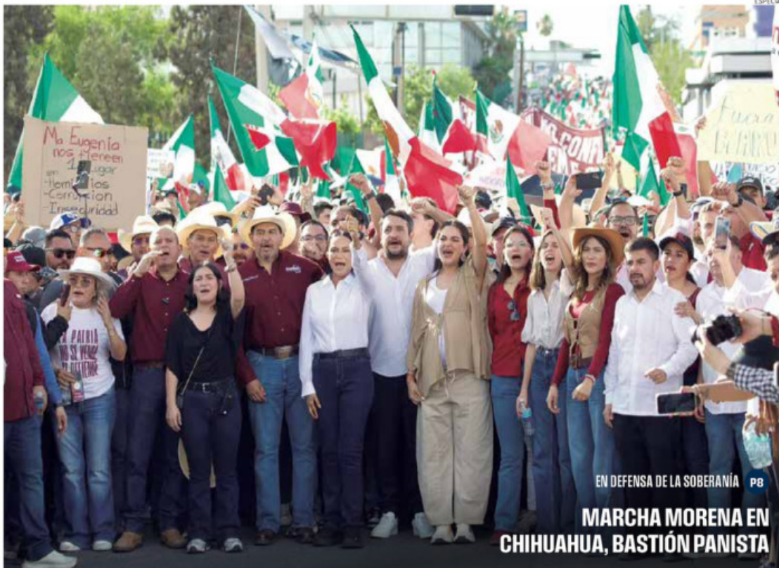
EN DEFENSA DE LA SOBERANÍA P8 MARCHA MORENA EN CHIHUAHUA, BASTIÓN PANISTA