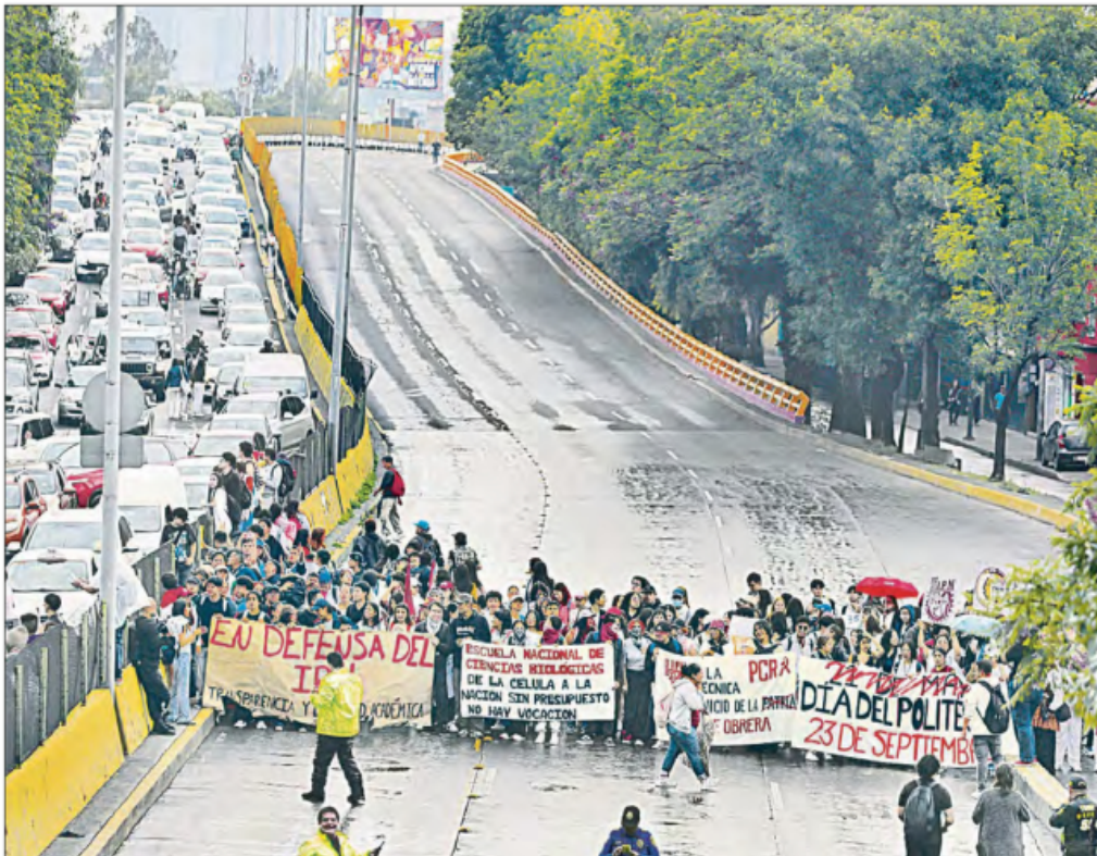
▲ Estudiantes del Politécnico Nacional llevaron a cabo un plantón ayer en instalaciones de Canal Once y un bloqueo en una de las principales arterias de la CDMX para exigir solución a su pliego

Paralizan alumnos del IPN una hora Circuito Interior