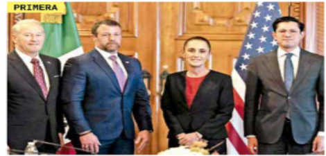
ENCUENTRO BINACIONAL

POR XIMENA MEJÍA La presidenta Claudia Sheinbaum anunció el envío de una iniciativa de reforma a la Ley General de Instituciones y Procedimientos Electorales para crear una comisión que vigile que los candidatos de los partidos no tengan vínculos con el crimen organizado.