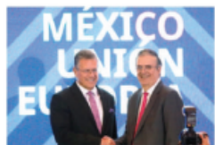
EBRARD con Maroš Šefčovič, ayer en la cumbre.

FIRMAN hoy Acuerdo Global Modernizado; van por más intercambios ante redefiniciones impulsadas por EU; en tiempos de regionalización elegimos tender puentes: IP. pág. 19