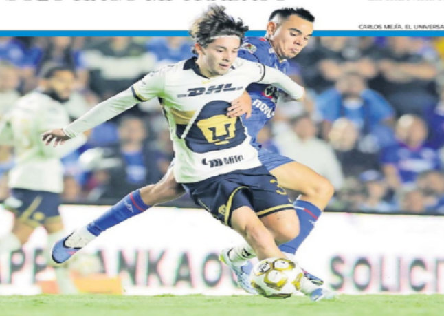
CARLOS MEJÍA, EL UNIVERSAL