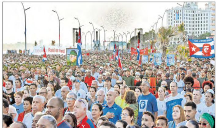
▲ “Mientras viva, permaneceré al frente de la revolución, con un pie en el estribo”, fue el mensaje que envió el líder cubano a miles de personas que protestaron en el malecón, ante la embajada de Estados Unidos, luego de que este país emitió una orden de captura en su contra.