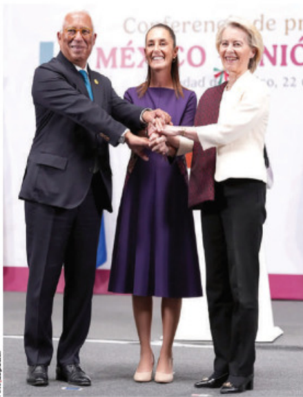
LA MANDATARIA con la presidenta de la Comisión Europea y el presidente del Consejo Europeo, ayer.

Harfuch se reúne con la Alta Representante de la UE para Asuntos Exteriores y Política de Seguridad; irán contra cárteles y crimen transnacional págs. 3,4 y 6