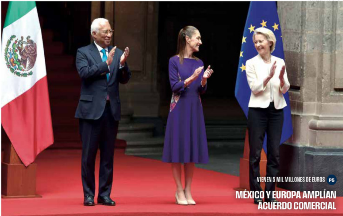
VIENEN 5 MIL MILLONES DE EUROS P5 MÉXICO Y EUROPA AMPLÍAN ACUERDO COMERCIAL

P6 PEMEX La alianza con Petrobras incluye aguas profundas