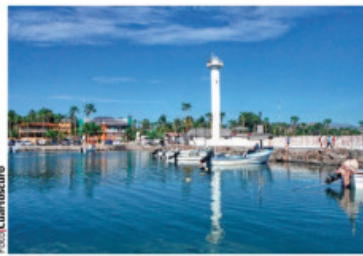
PUERTO de Loreto, Baja California Sur.

DECRETO permitirá normalizar las operaciones de manera oficial, destaca la dependencia; impulsará desarrollo económico, estiman. pág. 8