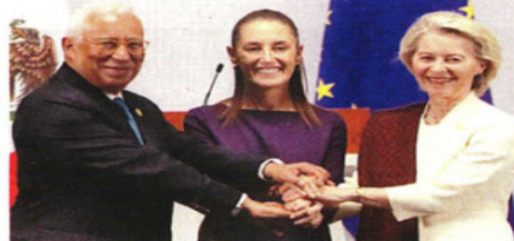
Antonio Costa, presidente del Consejo Europeo, Claudia Sheinbaum y Ursula von der Leyen, presidenta de la Comisión Europea, firmaron el acuerdo global modernizado.