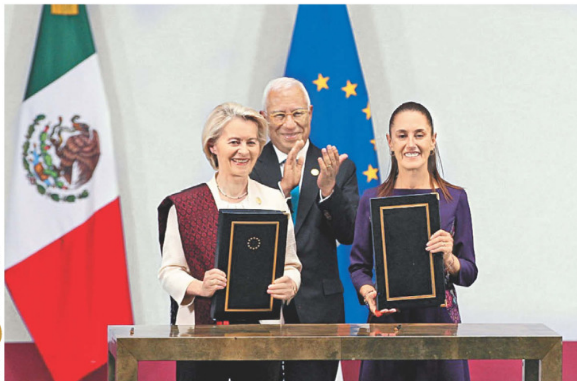
Ursula von der Leyen, António Costa y la Presidenta durante la firma del acuerdo que borra aranceles con Europa.

Arturo Pérez-Reverte San Remo como referente sentimental P. 24