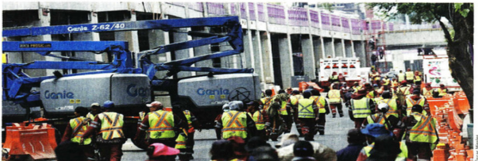
■ Aspecto de las obras en Chabacano y San Antonio en dirección el Centro Histórico.

6 personas, entre alcaldes y funcionarios de Morelos por sus vínculos con el crimen y por ser parte de una red de extorsionadores en al menos 11 gobiernos municipales.