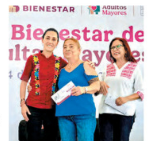
Gira por Tabasco.

La Presidenta rendirá un informe el próximo 31 de mayo, pero pide transmitirlo en plazas de las 32 entidades. PAG. 6