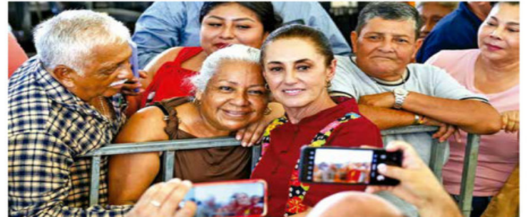
El 31 de mayo, la presidenta Sheinbaum conmemorará el segundo aniversario de su victoria electoral.