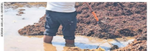
Los trabajadores que retiran el sargazo de las playas del Caribe mexicano quedan expuestos a sulfuro de hidrógeno, según el estudio.