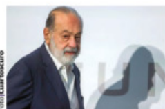
CARLOS Slim, ayer.

APLAUDE que la Presidenta priorice la inversión; hace falta detonar más, recalca; ve a Pemex como el principal problema. pág. 23