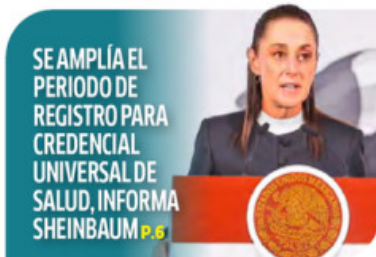
SE AMPLÍA EL PERIODO DE REGISTRO PARA CREDENCIAL UNIVERSAL DE SALUD, INFORMA SHEINBAUM P. 6

Morena y sus aliados justificaron las modificaciones a la reforma que aprobaron hace dos años, al señalar que las grandes transformaciones democráticas no son procesos estáticos. Oposición advierte que los ajustes son una salida temporal y calificó los cambios como una propuesta disfuncional que generó incertidumbre jurídica MÉXICO P. 4