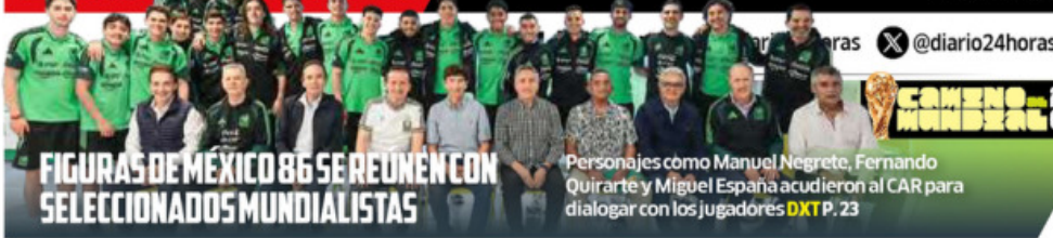
FIGURAS DE MÉXICO 86 SE REUNEN CON SELECCIONADOS MUNDIALISTAS