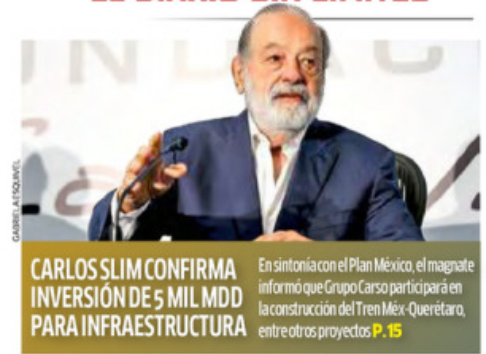
CARLOS SLIM CONFIRMA INVERSIÓN DE 5 MIL MDD PARA INFRAESTRUCTURA