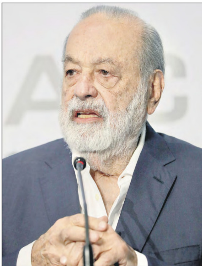
▲ En su conferencia de prensa anual, que duró una hora con 40 minutos, Slim Helú consideró que el país sigue siendo

atractivo para inversionistas y que las industrias estadounidenses ya no son tan competitivas.