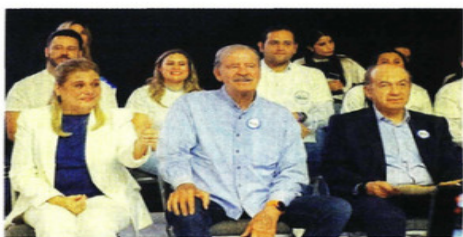
La Gobernadora Maru Campos y los ex Presidentes Vicente Fox y Felipe Calderón en el encuentro panista en la Expo Chihuahua.