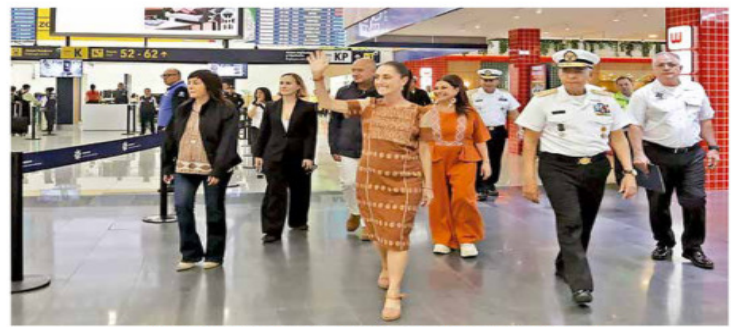
"SE REMODELÓ CON RECURSOS AUTOGENERADOS"