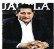
Jesús Corona, Alcalde Cuautla, acusado de delincuencia organizada y extorsión.