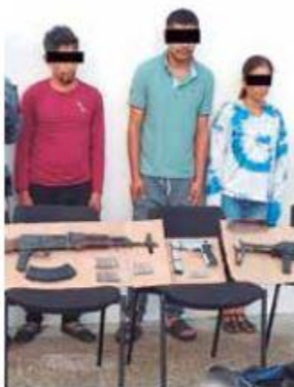
GOLPE. Junto a los 3 detenidos se aseguraron armas y equipo.