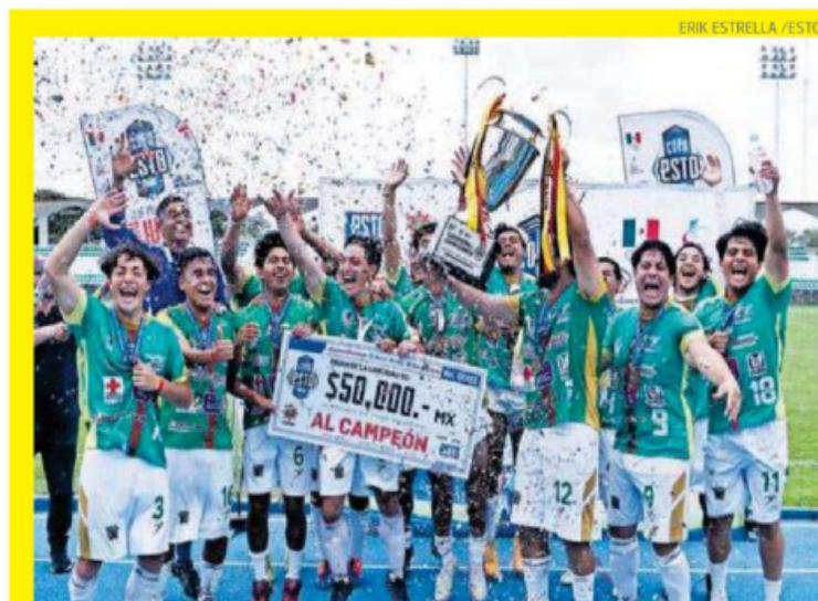
ERIK ESTRELLA / ESTO