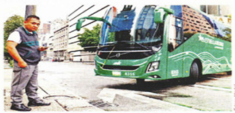
Uno de los conductores detalló a REFORMA su pliego.