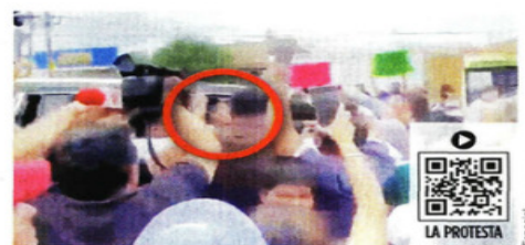
Maestros buscaron abordar a la Presidenta en la camioneta donde viajaba con la Gobernadora Tere Jiménez.

Paseo de la Reforma se llenó ayer de color durante el Gran Desfile Mundialista. Globos, comparsas, catrinas y carros alegóricos alusivos al torneo partieron de la Glorieta de la Diana y llegaron al Monumento a la Revolución, entre la efervescencia futbolera de los asistentes. CIUDAD 6