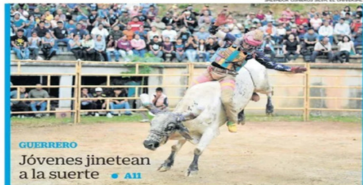
SALVADOR CISNEROS SILVA, EL UNIVERSAL