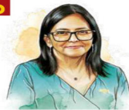
Ilustración: Erick Retana

A seis meses de caer Maduro, Delcy Rodríguez, presidenta de Venezuela, purga al chavismo, pacta con Trump y entrega cabezas a EU. / 17