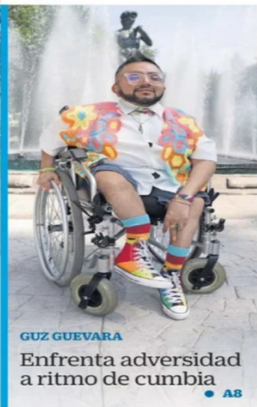
CAROLINE/A. EL UNIVERSAL

● Miami.— El presidente estadounidense cumple años con el deseo de tener monumentos, billetes e institutos con su nombre. Mientras crecen dudas sobre su salud, la Casa Blanca niega anomalías en el estado físico y mental. ● A12