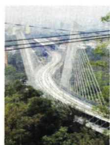
Viaducto Atirantado Manantial Santa Fe.

La Agencia explicó que el sistema integral de revisión permitirá detectar deformaciones que puedan comprometer la infraestructura.