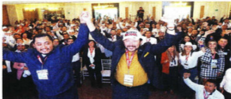
Una de las asambleas de la organización Que Siga la Democracia, a la cual se le negó ayer el registro como partido.

Durante la sesión del Consejo General del INE, la consejera electoral Frida Gómez propuso cambiar el sentido del dictamen que avalaba el registro de Que Siga la