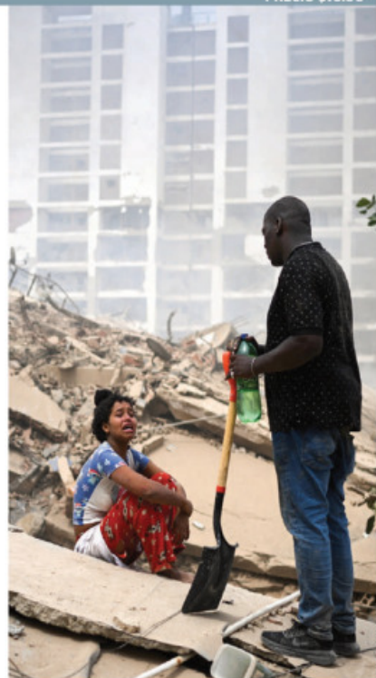
UNA MUJER llora sobre escombros en Guaira, ayer.

Hospitales colapsan; zonas aisladas y sin luz; diáspora aquí sirve de antena para enlazarlos; 9 países envían ayuda, México, equipo de rescate págs. 9, 22 y 23