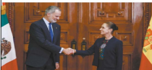
DIEGO PINO LAMONTE, EL UNIVERSAL

● Después de 7 años, el rey de España, Felipe VI, regresó a México y se reunió con Sheinbaum. Hablaron de fortalecer la relación bilateral y de los pueblos originarios. ● A4