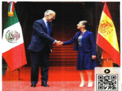
La Presidenta Sheinbaum recibió ayer, en Palacio Nacional, al Rey Felipe VI de España.