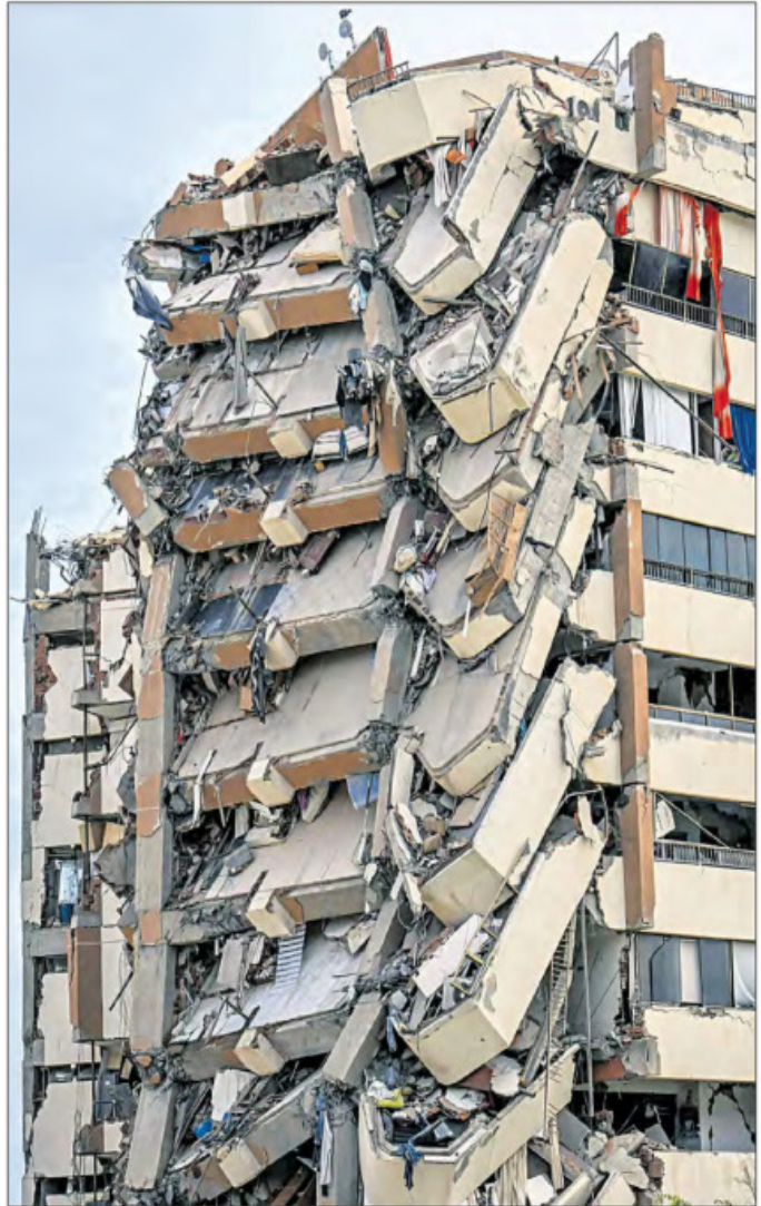
▲ Contingentes de espontáneos, entre ellos obreros de la construcción, se han abocado al esfuerzo titánico de remover con sus manos, cubetas, martillos y