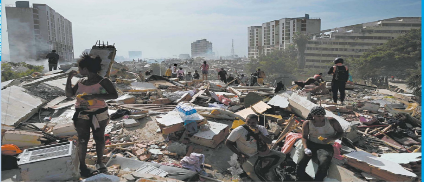
FEDERICO FABRA, AP