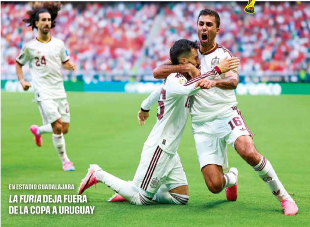
EN ESTADIO GUADALAJARA LA FURIA DEJA FUERA DE LA COPA A URUGUAY

Por juego del Tri Repite Ciudad de México el home office para el martes