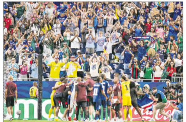
▲ En la imagen superior, jugadores de Uruguay se consuelan tras ser eliminados; sobre estas líneas, un aficionado de La Celeste en