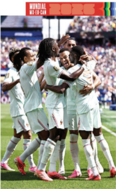
MUNDIAL MX-EE-CAN 2026