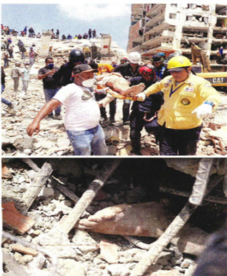
■ Cientos de edificios colapsaron en Venezuela y la población denuncia la ausencia del Gobierno en las labores de rescate.

“No coincidimos en la violencia y extorsión como formas de presión política, fundada en la idea de que sólo mediante paros, bloqueos, conflictos y afectación a terceros, se pueden lograr conquistas.”