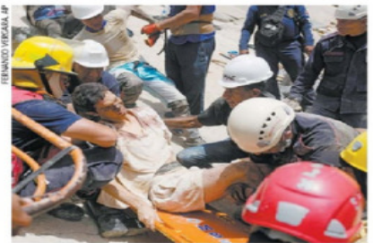
Labores de rescate en Catia la Mar, Venezuela.