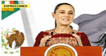
DESTACA RED CULTURAL