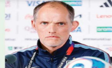
Tuchel, DT de Inglaterra, aseguró que superarán la altitud de la CDMX.