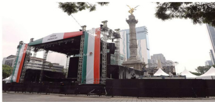
El Ángel de la Independencia, protegido con vallas, recibirá hoy a 25 mil fanáticos.