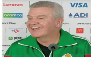
"El Vasco" transmitió confianza en su conferencia: "lo mejor está por venir".

Como parte del Plan Kukulcán, la SSPC, la Defensa Nacional, la Marina, la Guardia Nacional y autoridades locales reforzaron la seguridad con patrullajes, monitoreo, vigilancia aérea y centros de coordinación.